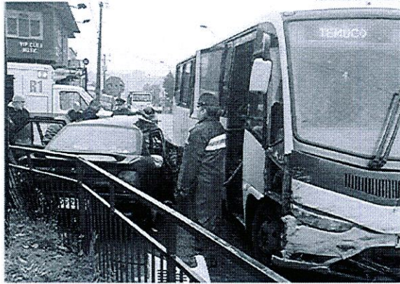
LA FUERZA DEL IMPACTO ACABÓ CON LA VIDA DEL CONDUCTOR DEL VEHÍCULO MENOR.