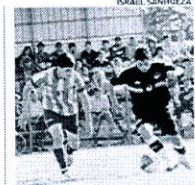
MÁS DE 500 FUERON LOS ASISTENTES.