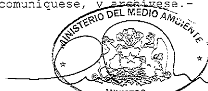
PABLO BADENIER MARTÍNEZ Ministro del Medio Ambiente