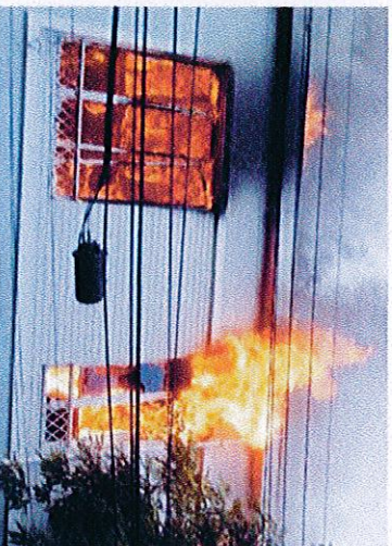
EL FUEGO SE INICIÓ EN EL SEGUNDO PISO Y SE EXPANDIÓ RÁPIDO.

Según las primeras diligencias realizadas por Ca-