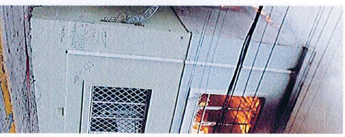
TOTALMENTE DESTRUÍDA QUEDÓ L

“Yo estaba trabajando en el balcón de mi casa, que está al frente, y vi que salía humo. Entre por unos segundos y cuando volví a salir vi una tremenda llamas