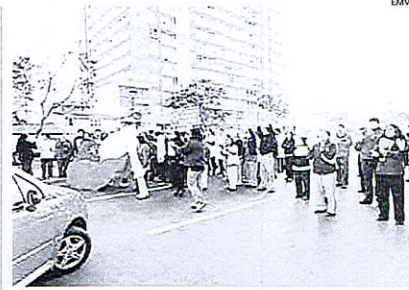
FUNCIONARIOS REALIZARON UNA PROTESTA EN CALLE ÁLVAREZ.

El fiscal detalló que "la suspensión condicional dura un año. Si se incumple cualquiera de estas condiciones, se revoca y se sigue adelante con el procedimiento judicial, se va a juicio oral. Ésa es la herramienta que tenemos nosotros a la mano para asegurarnos que todas las condiciones se cumplan. Si hubiera sido un acuerdo reparatorio habría sido distinto". Y acotó: "La idea es ir cerrando todos los temas (con Codelco y La Greda)".