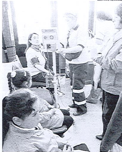
EN MARZO DE 2011 CERCA DE 40 NIÑOS RESULTARON INTOXICADOS.