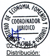
LUIS FELIPE CÉSPEDES CIFUENTES MINISTRO DE ECONOMÍA, FOMENTO Y TURISMO

Sin otro particular, le saluda atentamente,