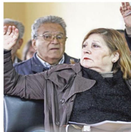
En la elaboración del anteproyecto intercomunal, se realizaron consultas ciudadanas.

Desde el pasado viernes comenzó la etapa de consulta ciudadana en Chillán, la que durará hasta el 5 mayo.