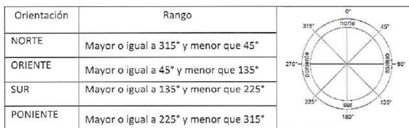
Tabla N° 9. Definición de orientaciones de los muros perimetrales para acreditación del cumplimiento de exigencias del complejo de elementos traslúcidos

b) Identificar el porcentaje máximo permitido de superficie de ventana por orientación, según transmitancia térmica del complejo de ventanas conforme a la Tabla 14. En el caso que el proyecto de arquitectura considere ventanas de distinto valor de transmitancia térmica U en una misma orientación, el porcentaje máximo permitido de superficie de ventanas corresponderá al de la ventana de mayor valor U de dicha orientación.