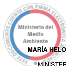
MARÍA HELOISA JUANA ROJAS CORRADI MINISTRA MINISTERIO DEL MEDIO AMBIENTE