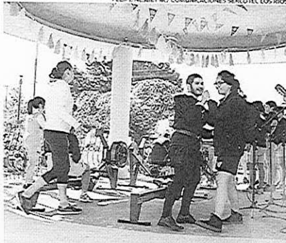
LA GLORIETA DE LA PLAZUELA BERLÍN FUE EL CENTRO DE LAS ACTIVIDADES.

Plazuela Berlín, otros lugares que son parte de este programa son el barrio Esmeralda y Los Molinos, en Valdivia, y la calle Comercio de La Unión.