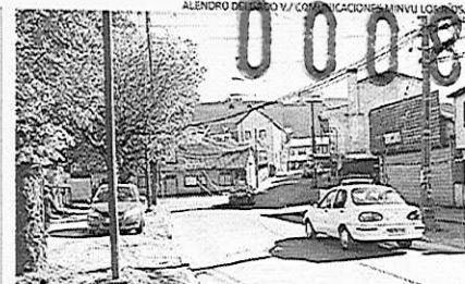
LOS SERVICIOS ESPERAN EXIGIR MEDIDAS CORRECTIVAS AL MUNICIPIO.

Los seremis de Vivienda y Transportes ingresaron a la Contraloría un requerimiento para "clarificar las atribuciones" que les permitan exigir al municipio valdiviano las medidas correctivas al Estudio de Impacto sobre el Sistema de Transporte Urbano (EISTU) de las obras que se ejecutan en el mall Plaza de Los Ríos.