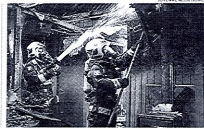
NUEVE COMPAÑÍAS DE BOMBEROS TRABAJARON EN LA EMERGENCIA.